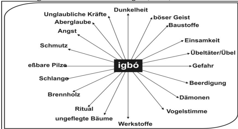
Abbildung 3a: Assoziationen mit igbó (Wald)

und in Yorùbá analysiert. Die Kulturspezifität der Wörter wurde durch direkte Interviews mit Muttersprachlern und durch Fragebogen festgestellt und überprüft. Folgende Wörter 22 wurden bei Muttersprachlern getestet: igbó/Wald